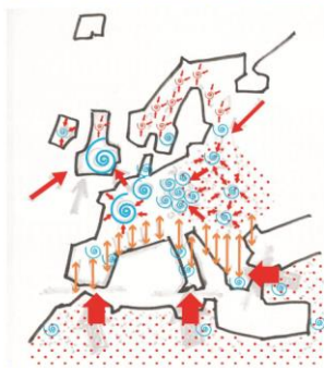
Figure 8 Territorial impressions of demographic change in the 2030s